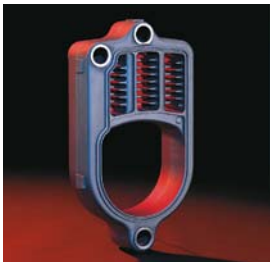
Die Eutectoplex-Heizfläche garantiert Langlebigkeit und eine hohe Betriebssicherheit.

* Voraussetzungen und Produktübersicht unter www.viessmann.de/garantie