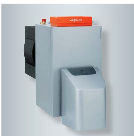
Vitorondens 200-T im Leistungsbereich von 67,6 bis 107,3 kW