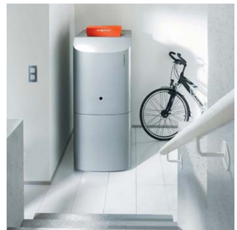
Vitorondens 222-F mit integriertem Warmwasserspeicher

Die Regelung Vitotronic 200 mit Klartextanzeige und grafischer Unterstützung ermöglicht dem Nutzer eine einfache, selbst erklärende und menügeführte Bedienung. Über die Vitotronic lassen sich Heizungsanlagen mit einem ungemischten und bis zu zwei gemischten Heizkreisen komfortabel regeln.